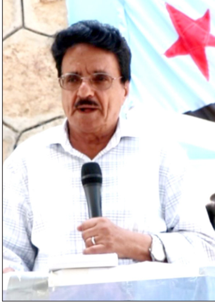
كتب / قاسم صالح ناجي

ان إيقاع الوضع الراهن الذي نعيش فيه اليوم ، يفرض الحذر في الحركة التي لا ترى لنفسها مقصدا او عملا لا نستطيع تحقيقه ، او قد نحيد عنه بحكم طبيعة هذا الوضع .