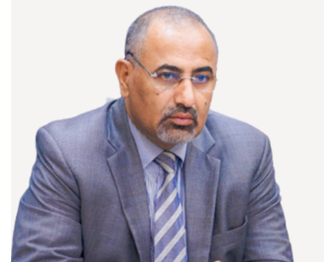
والدور الألماني في الدفع بعملية السلام في المنطقة بما يتوافق

سياسياً، استمعت هيئة الرئاسة إلى إحاطة قدمها عضو هيئة الرئاسة، رئيس وحدة شؤون المفاوضات، الدكتور ناصر محمد الخبجي عن زيارة فريق المجلس إلى العاصمة الألمانية برلين ونتائج لقاءاته، مع المسؤولين الألمان وأفاق تعزيز العلاقات الثنائية،